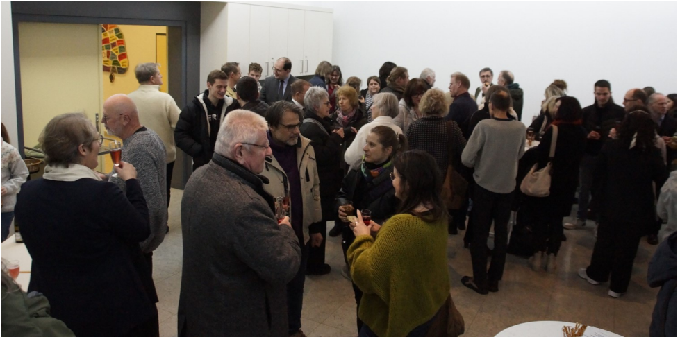
Beim anschließenden Empfang

Ein weiteres Highlight war der Konfi-Cup, ein Fußballturnier der Konfis im Kirchenbezirk, bei dem ich an der Planung und Durchführung mitwirken durfte. Besonders stolz bin ich darauf, dass eine der beiden Mannschaften aus Kraichtal den zweiten Platz erringen konnte.