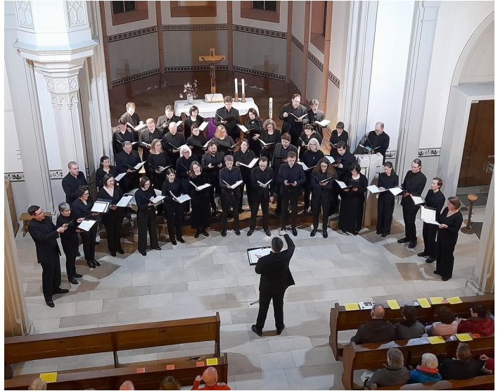
Der Kammerchor der Christuskirche Karlsruhe

Zum Abschluss der Kirchenmusiktage fand in der vollbesetzten Mauritiuskirche in Oberöwisheim der zentrale Festgottesdienst statt. Über 60 Bläserinnen und Bläser, Mitglieder der Kraichtaler Posaunenchor