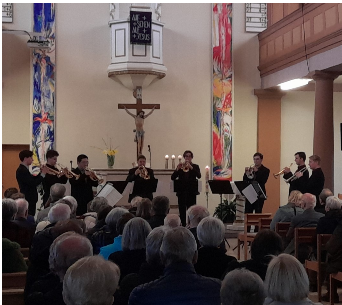
Das Trompetenensemble beim Vortrag

Die sieben, jungen Trompeter und ihr Lehrer spielten Werke für drei bis acht Trompeten, teilweise von der Orgel begleitet. Das virtuose Spiel der jungen Musiker begeisterte das Publikum in der Unteröwisheimer Kreuzkirche.